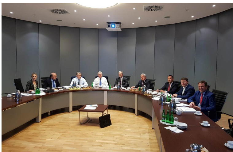
У Варшаві представники парламентів Польщі, України, Литви та громадянського суспільства домовились про спільну розробку стратегії трансформації нашої країни