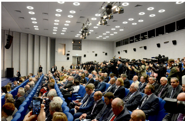
Форум українського бізнесу збирає підприємництво, урядовців, громадських активістів та ЗМІ