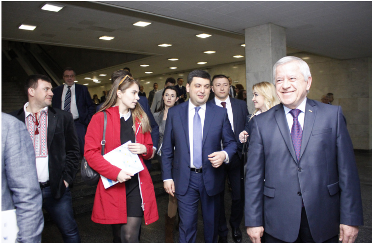
Завершилась зустріч ділової спільноти з очільником уряду В.Гройсманом