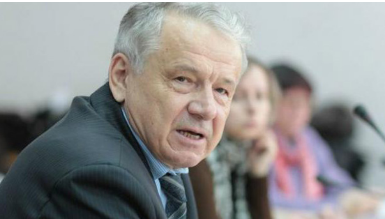
З виступу директора Інституту економіки та прогнозування Валерія Гейця

Східноєвропейські сусіди сьогодні мають більш високу динаміку економічного зростання. Що робитиме українець в умовах нестабільності і відсутності динаміки росту? Поїде в ці країни. Потенційна втрата працездатного населення надзвичайно велика, і долати її треба лише економічним зростанням та підвищенням доходів. Якщо людині в Україні немає де заробити гроші, усі розмови про припинення міграції марні, ми живемо в умовах відкритих ринків.