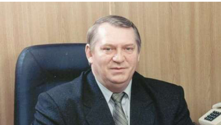
З виступу президента Будівельної палати України, Героя України Петра Шилюка

Східноєвропейські сусіди сьогодні мають більш високу динаміку економічного зростання. Що робитиме українець в умовах нестабільності і відсутності динаміки росту? Поїде в ці країни. Потенційна втрата працездатного населення надзвичайно велика, і долати її треба лише економічним зростанням та підвищенням доходів. Якщо людині в Україні немає де заробити гроші, усі розмови про припинення міграції марні, ми живемо в умовах відкритих ринків.