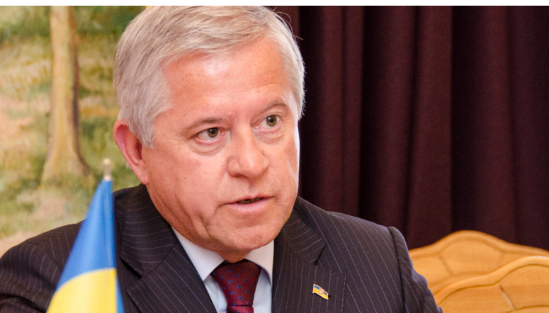
З виступу голова Антикризової ради громадських організацій, президента УСПП А.Кінаха

Відтік трудових ресурсів в Україні поглиблюється практично на очах. Кваліфіковані фахівці, робітники, працівники бюджетної сфери – медицини, науки, освіти – їдуть з України безперестанку. Ми дожили до того, що «живий» інвестор не може сформулювати персонал для реалізації проекту і часто вимушений його закрити. Це співпадає з значними демографічними проблемами. В минулому році наша держава стала четвертою в світі за рівнем смертності. За три поточних місяці чисельність населення знизилася на 63 тис. В попередні роки за рік ми втрачали від 180 до 200 тис. Суспільство