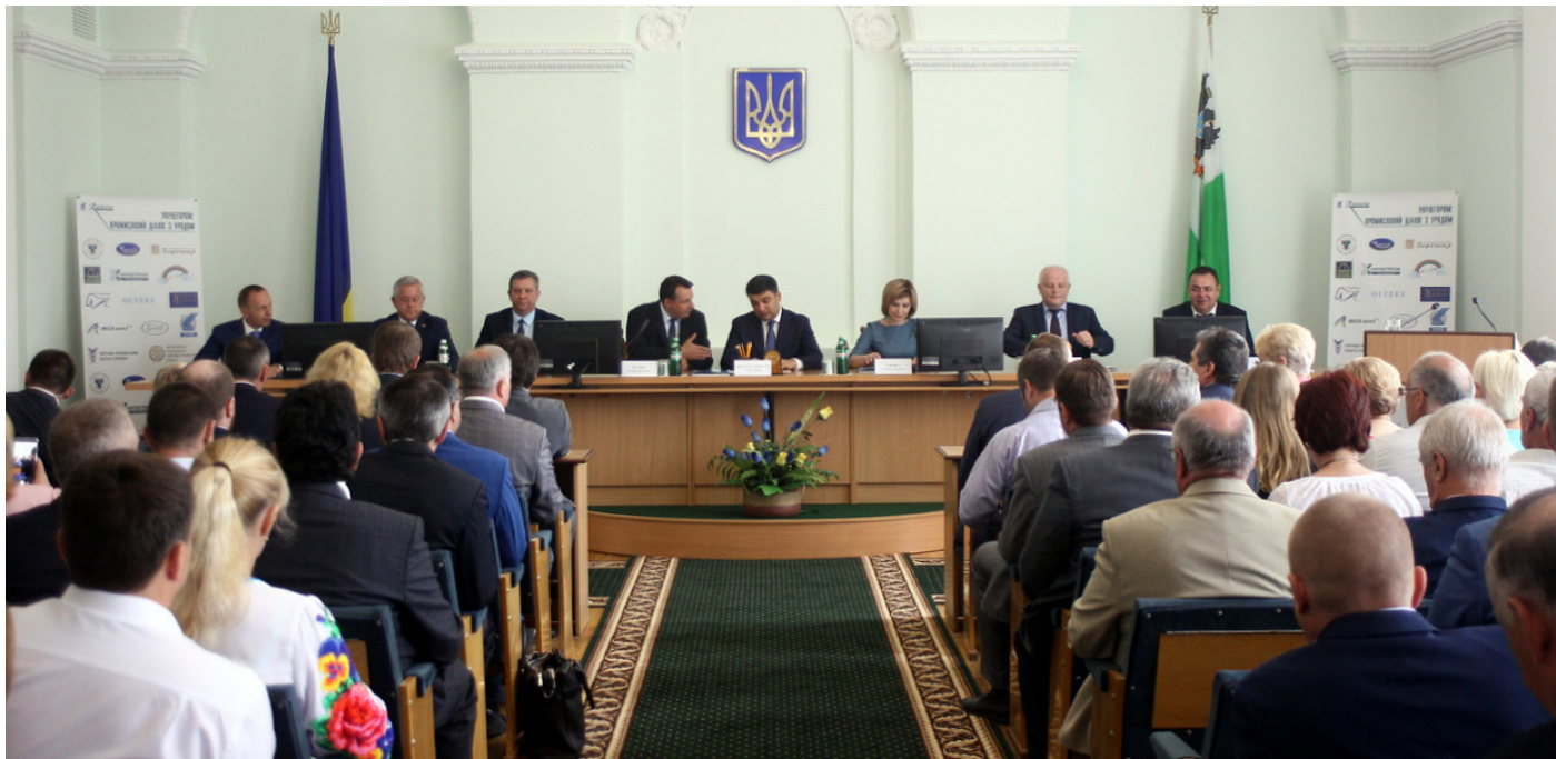
В президії форуму (зліва направо): Чернігівський міський голова Владислав Атрошенко, президент УСПП Анатолій Кінах, міністр соціальної політики Андрій Рева, голова ЧОДА Валерій Куліч, Прем'єр-міністр України Володимир Гройсман, голови правління асоціації «Укрлегпром» Тетяна Ізовіт, перший віце-прем'єр-міністр України — міністр економічного розвитку і торгівлі Степан Кубів, голова облради Ігор Вдовенко

За умови стабільної платоспроможності та підвищення рівня життя населення ринок товарів легкої промисловості є привабливим для інвесторів, має всі передумови для динамічного розвитку. Адже, крім вагомого обсягу внутрішнього ринку (125 млрд.грн. на рік), легка промисловість значною мірою (43,3%) експортоорієнтована і має можливості для нарощування експортного потенціалу.