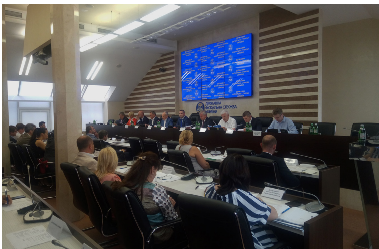
На засіданні ради з питань стимулювання інвестицій в ДФС України обговорили шляхи удосконалення податкової системи