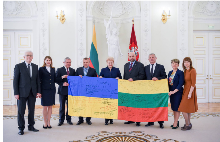
Вітчизняні волонтери подякували президенту Литви Д.Грибаускайте за підтримку українського народу під час АТО. Зустріч відбулася за підтримки УСПП