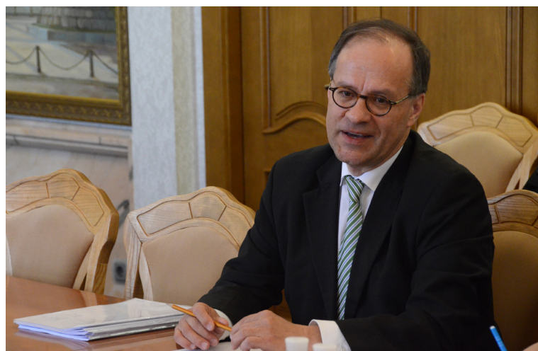
Представник Міжнародного бюро праці Крістіан Хесс (Женевське відділення) обговорює з керівництвом ООРУ проект МОП в Україні, покликаний сприяти покращенню вітчизняного ділового клімату, ефективності соціального діалогу