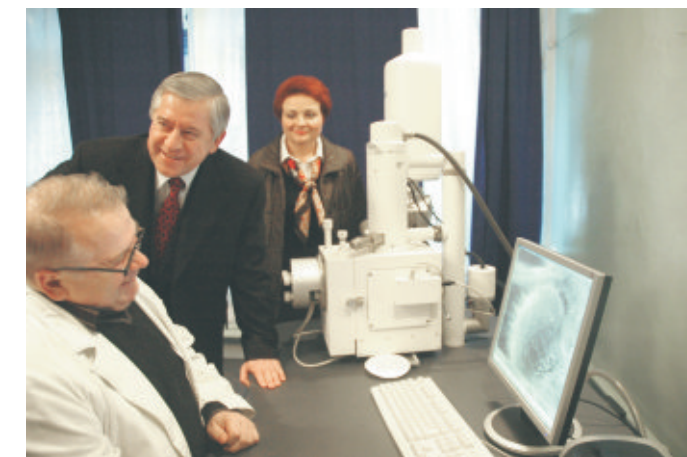
Зустріч Президента УСПП А. Кінаха з промисловцями Сумщини