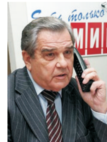
Президент регіонального відділення УСПП у Запорізькій області Петро Ванат

Уже отримана відповідь від Мінпраці та Міносвіти і науки з інформацією про те, що на даний час уже робиться владою для вирішення цієї проблеми.