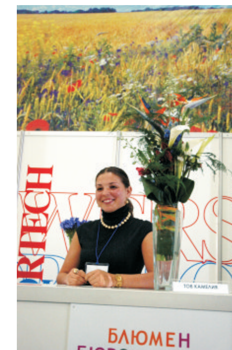
Флорист виставки підготувала букет «Портрет політика А. Кінаха мовою квітів»