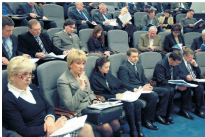
Члени Правління УСПП