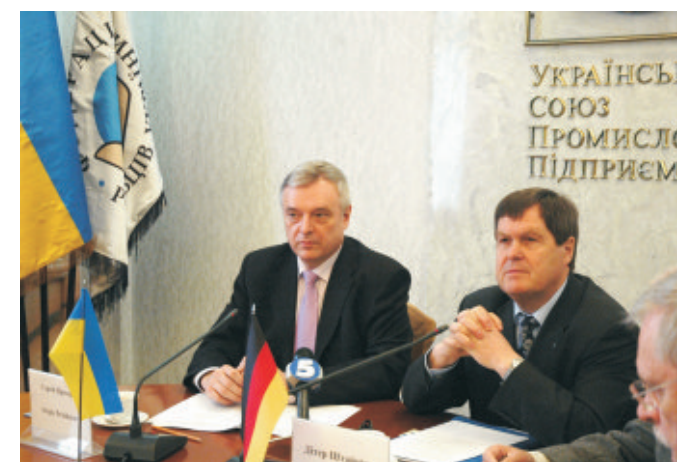
Перший віце-президент УСПП С. Прохоров та голова правління Німецько-українського форуму, президент земельного парламенту (ландтагу) землі Саксонія-Ангальт Дітер Штайнеке