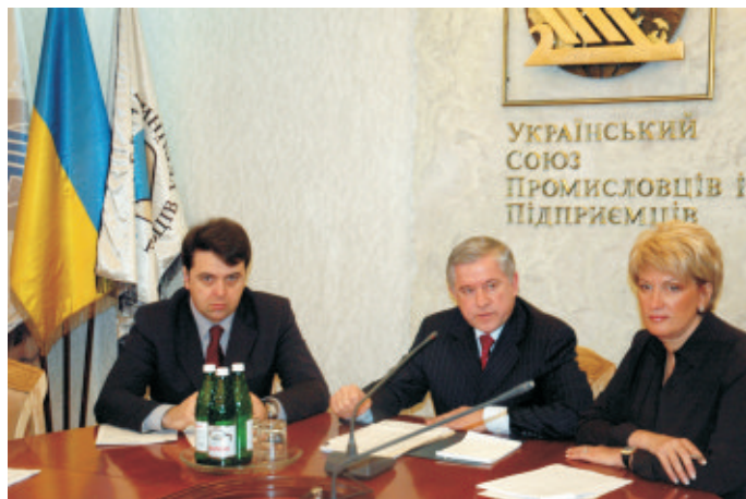
Голова Державного комітету України з питань регуляторної політики та підприємництва К. Ващенко, Президент УСПП А. Кінах, віце-президент УСПП Л. Денисюк під час засідання «круглого столу» «Регуляторна політика – завдання парламенту, уряду і громадськості»