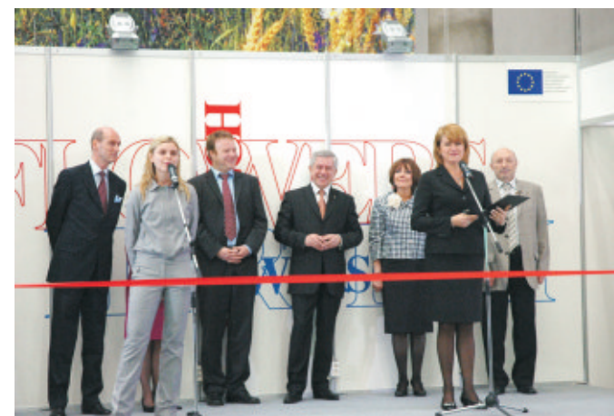
Відкриття III Міжнародної спеціалізованої виставки з квіткового бізнесу, садівництва, ландшафтного дизайну та флористики