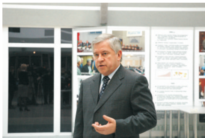
Брифінг Президента УСПП А. Кінаха