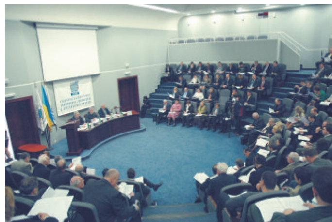
На засіданні Правління УСПП