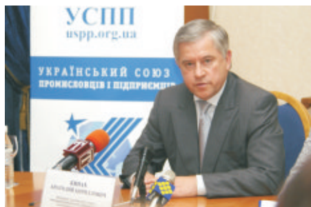
Президент УСПП Анатолій Кінах