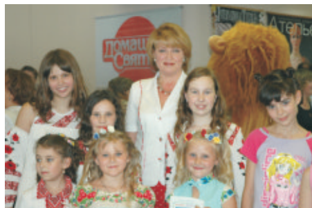
На благодійному заході