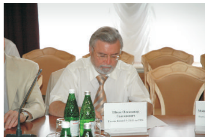
Матеріали вимагають ретельного вивчення