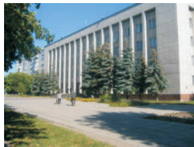
Господарський суд Черкаської області

Регіональне відділення УСПП у Черкаській області систематично проводить моніторинг роботи дозвільної системи у сфері господарської діяльності, в тому числі центру при Черкаському міськвиконкомі, який працює близько року та за рейтингом посідає восьме місце в Україні. Однак і тут є проблеми. З 44 дозволів, які мають право видавати адміністратори, в Черкасах опановано лише дев'ять: три – у сфері регулювання земельних відносин, чотири – у сфері архітектури та містобудування, по одному дозволу – у сфері торгівлі та фінансової діяльності.