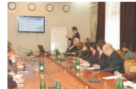
Семинар-тренинг в УСПП

В конце концов, именно я приучил их действовать именно так. И приложил много усилий, чтобы внедрить в их работу те стандарты, которые сейчас мешают нам быстро адаптироваться к новой ситуации. А стал ли я сам работать и думать иначе? Возможно, этот внутренний саботаж происходит сейчас и во мне?