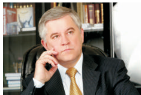
Президент Українського союзу промисловців і підприємців, народний депутат України Анатолій Кінах

■ «Сам по собі механізм міждержавних позик є загальноприйнятною практикою, і це можна навіть вітати, якщо кошти направляються не на споживання, а на розвиток – реалізацію інфраструктурних проектів, імпортозаміщення, розвиток житлового будівництва, реалізацію проектів Євро-2012. Разом із тим слід враховувати, що, за даними Міністерства фінансів, станом на 31 грудня 2008 року державний борг України становив 130,6 млрд. грн., гарантований – 58,9 млрд., співвідношення – 2,2:1. У тому числі державний зовнішній борг становив 11,2 млрд. дол., гарантований зовнішній борг – 7,4 млрд. дол., співвідношення – 1,5:1. Тому політика міждержавних позик повинна ставити за мету стимулювання внутрішнього ринку та створення нових робочих місць. Споживчі ж позики будуть лише посилювати інфляцію і поглиблювати кризу», – переконаний Анатолій Кінах.