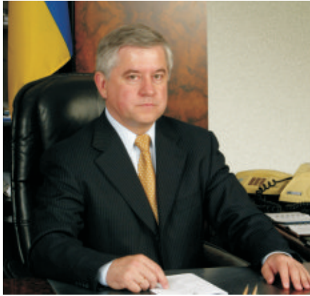
Президент Українського союзу промисловців і підприємців, народний депутат України Анатолій Кінах