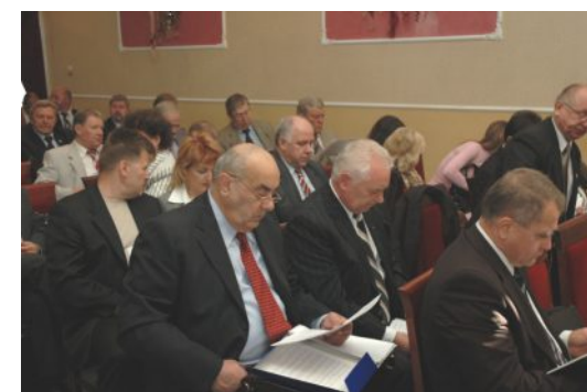
На пленарному засіданні