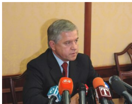
Анатолій Кінах, Президент УСПП