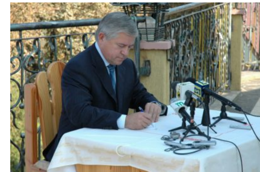
Закарпатська "родзинка": прес-конференція на відкритому повітрі