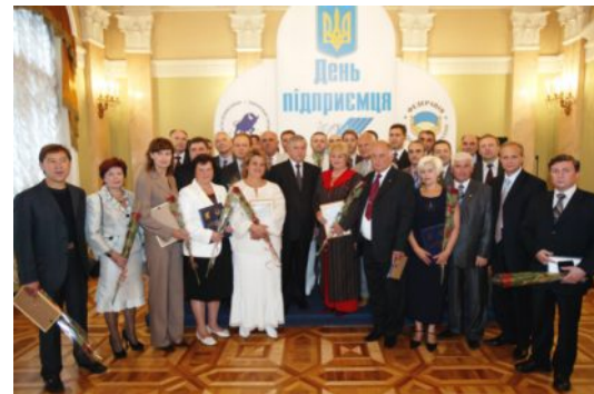
В тісному колі однодумців