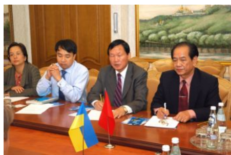
Під час переговорів

В'єтнамська сторона висловила зацікавленість у виході на український ринок та його освоєнні. Її представляли керівники провідних компаній, зокрема, таких, як DAIDONG, Vietnam Tea Cooperation, Future Generation, „CATNGHI”, DAILOC тощо.