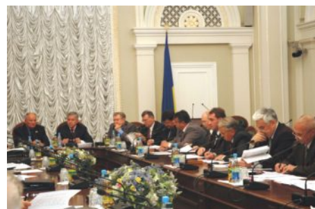
На засіданні Комітету з питань національної безпеки та оборони ВРУ