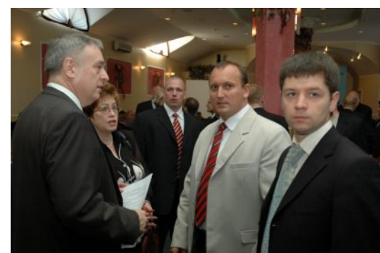
Перед початком 2-ї Міжрегіональної конференції підприємств-членів УСПП