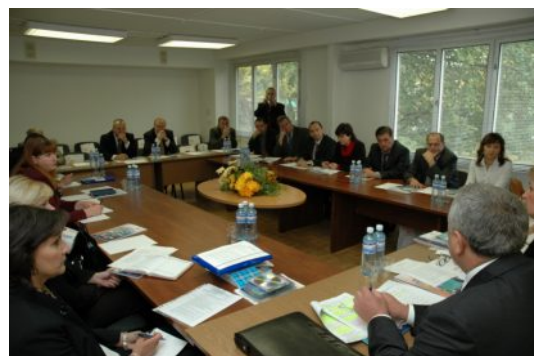
Обговорюємо питання сприяння розвитку підприємництва на прикордонних територіях