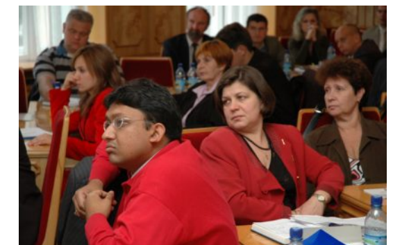
Під час засідання секції „Інструменти транскордонного співробітництва. Реалії та перспективи”