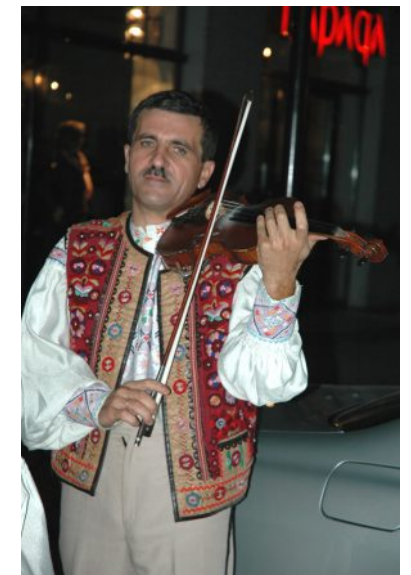
Закарпатські музики вітають ділову спільноту