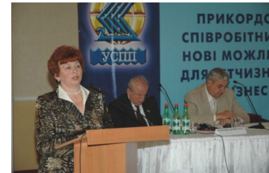
Віце-президент Тетяна Степанкова розповідає про інвестиційні програми