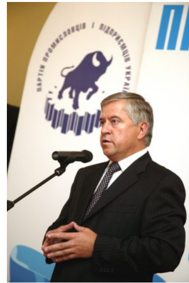
На святкуванні Дня підприємця