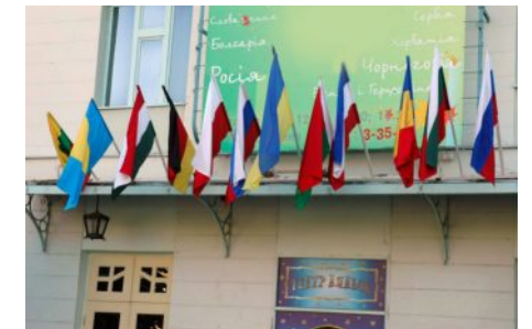
Ужгород вітає учасників конференції

За час дії СЕЗ та ТПР у Закарпатті сформовано такі експорторієнтовані галузеві комплекси, як машинобудування, електронна,