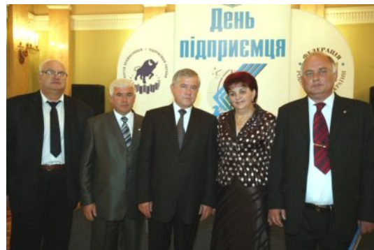
Вінничани зі своїм президентом