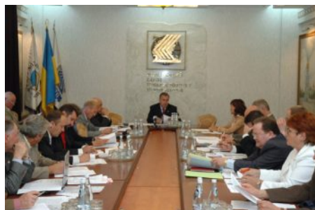
Йде обговорення законопроекту

Ділова спільнота пропонує прийняти новий закон про державні закупівлі. Розроблений фахівцями УСПП та ФРУ законопроект врахував численні пропозиції представників реального сектора економіки. Він передбачає усунення найсуттєвіших недоліків чинного Закону України „Про закупівлю товарів, робіт і послуг за державні кошти” – тривалості, складності та непрозорості процедур закупівель, невиправдано високої вартості на участь в тендерах, відсутності вільного доступу до інформації тощо.