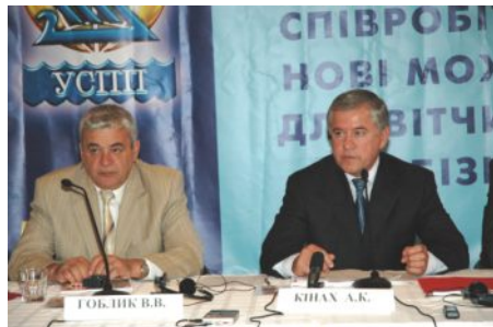
Президія конференції в Ужгороді