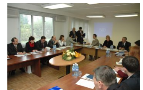
Підприємці-початківці Ужгорода можуть розраховувати на консультаційну підтримку бізнес-інкубатора