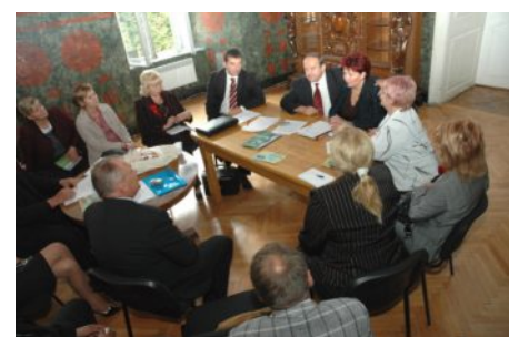
Засідання секції "Сучасний маркетинг в'їзного та виїзного туризму"

Запропонований проект розбудови транспортної мережі „Door-to-Door” є частиною міжнародної інвестиційної програми. Вартість її реалізації в цілому по Україні складає 2,5 мільярда доларів. Загальна довжина української мережі – понад 16 тисяч кілометрів.