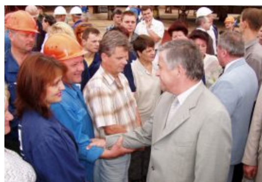
Президент УСПП А.Кінах з промисловцями Миколаївщини на заводі „Океан”