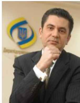
Андрій Дашкевич, голова Державного комітету з регуляторної політики та підприємництва, віце-президент УСПП

УСПП є своєрідним барометром підприємницького клімату. Це відображення інтересів, намірів та прагнень промисловців і підприємців. Цінність УСПП як громадської інституції полягає у виконанні ним ролі зв'язкового між владою і бізнесом. Тому, на моє особисте переконання, сьогодні важко знайти альтернативу УСПП.