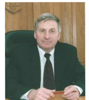
Микола Лаврик, голова Чернігівської обласної державної адміністрації, віце-президент УСПП