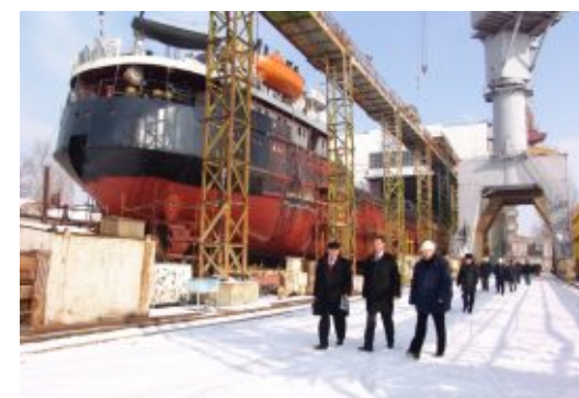
Судно готове до спуску на воду