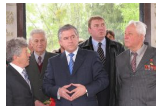
Під час зустрічі з ветеранами Великої Вітчизняної війни