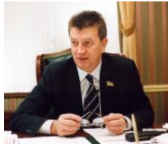
Василь Гуреєв, народний депутат України