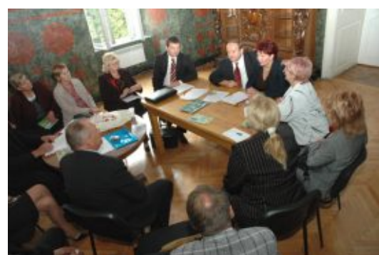
Круглий стіл з питань розвитку малого бізнесу