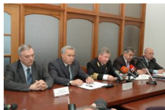
Під час конференції в АСК "Укррчфлот", присвяченої боротьбі з рейдерством