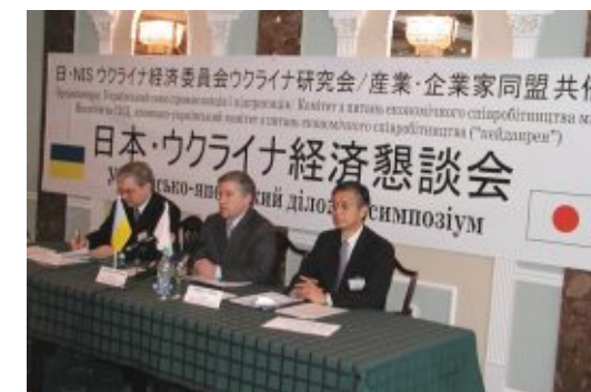
Під час українсько-японського бізнес форуму