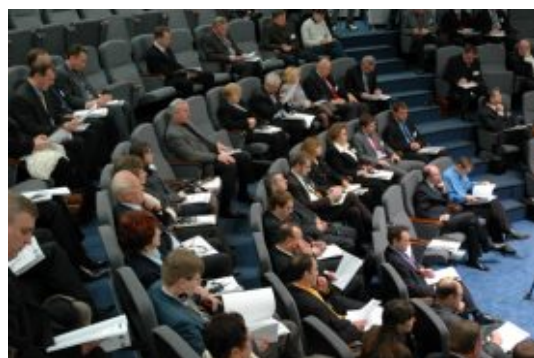
На засіданні правління УСПП