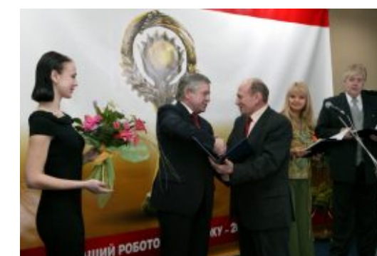
Всеукраїнський конкурс „Кращий роботодавець року”