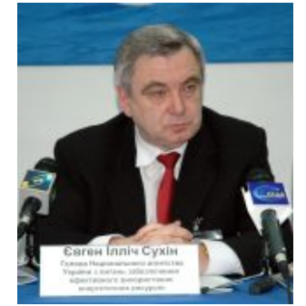
Євген Сухін, голова Національного агентства з питань ефективного використання енергоресурсів, віце-президент УСПП

Будучи головою Сумської, а нині Чернігівської обласної державної адміністрації, завжди дотримуючись принципів здорового прагматизму, зважених підходів, жорстко обґрунтованих рішень, моралі та відповідальності. В цих областях вдалося побудувати конструктивний принциповий діалог між владними структурами та підприємцями регіону. А це вже немало.