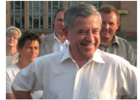
Анатолій Кінах, президент УСПП

УСПП вітає Анатолія Кінаха з десятиріччям перебування на посаді президента УСПП. Щиро зичимо Анатолію Кириловичу сил та наснаги, мудрості та витримки, миру і добра!