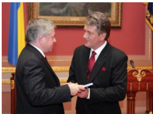
Президент України В.Ющенко вручає лідеру промисловців і підприємців А.Кінаху орден Ярослава Мудрого IV ступеня