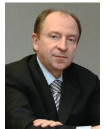
Станіслав Довгий, народний депутат України, віце-президент УСПП