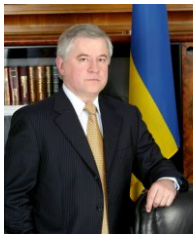
Анатолій Кінах, президент УСПП

Безперечно, на тлі сучасних політичних і соціально-економічних викликів новий рівень діяльності, досягнутий нашою організацією, потребує подальшого вдосконалення. Ми будемо рости та вдосконалюватися відповідно до потреб часу. Але якщо сьогодні хтось шукає „точку опори“ для найефективнішої реалізації національних інтересів, раджу їм звернути увагу на УСПП.