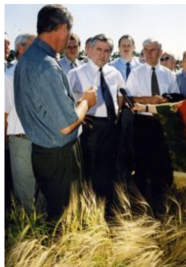
На полях Чернігівської області