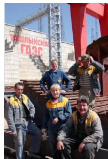
Будується новий об'єкт