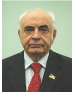
Віталій Майко, народний депутат України, віце-президент УСПП