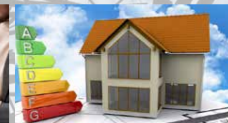
ENERGETSKA SANACIJA STAVB