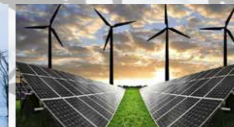
OBNOVLJIVI VIRI ENERGIJE