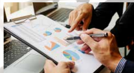
IZZIVI PRIDOBIVANJA IN IZOBRAŽEVANJA KADROV