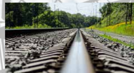
CESTNA IN ŽELEZNIŠKA INFRASTRUKTURA