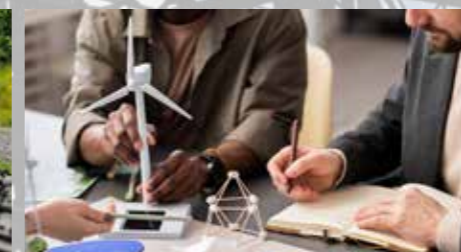
ZAGOTAVLJANJE TRAJNOSTNE INFRASTRUKTURE