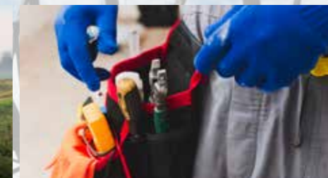
PREDSTAVITEV OBRJNIŠKIH IN INSTALACIJSKIH DEL