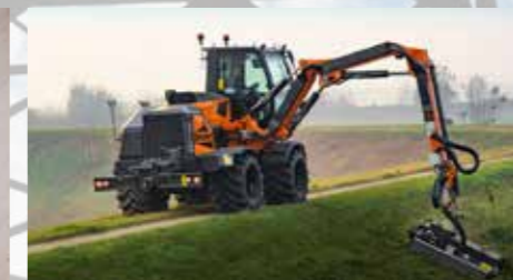
SODOBNA GRADBENA IN KOMUNALNA MEHANIZACIJA